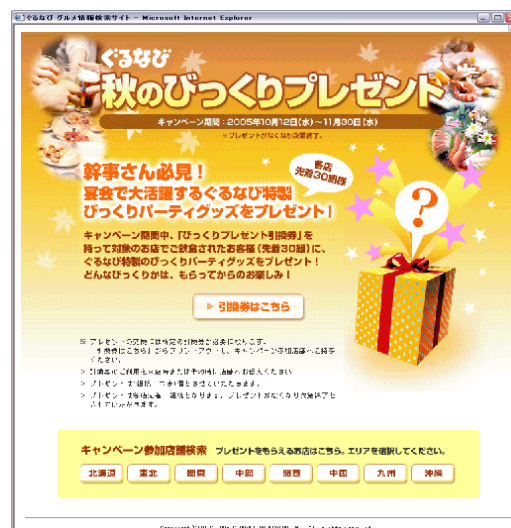
秋のびっくりプレゼントキャンペーンの告知ページ