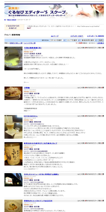
PC版「エディター‘S スcoop」TOP ページ